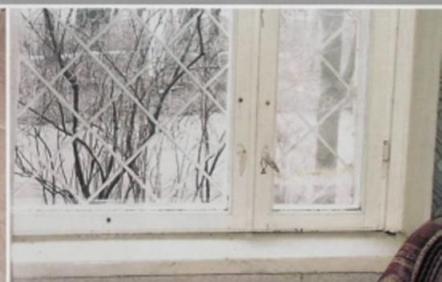
Уберите с окон горшки с цветами и поставьте их на пол