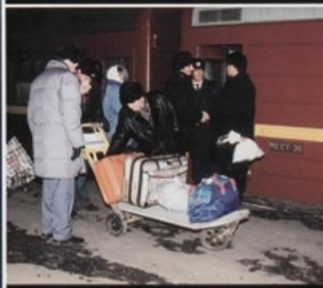
На вокзале, в метро