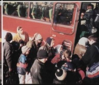
В общественном транспорте