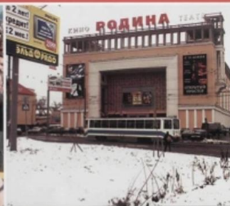
В зрелищных учреждениях