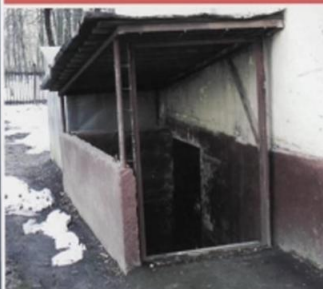
В подвале жилого дома