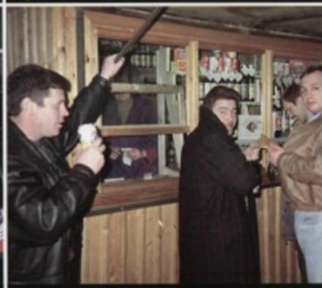
Возле торговой палатки