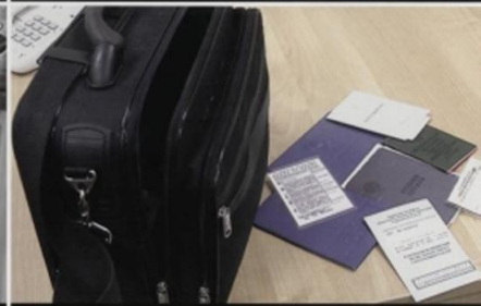
На случай эвакуации сложите в сумку наиболее важные документы, вещи