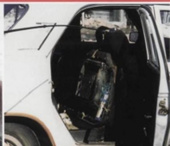
В припаркованной машине