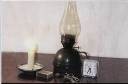
Подготовьте аварийные источники освещения