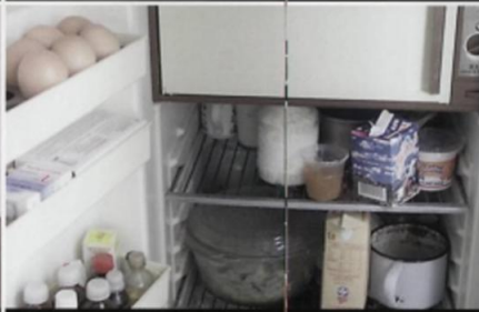
Задерните шторы, приготовьте запас воды и питания