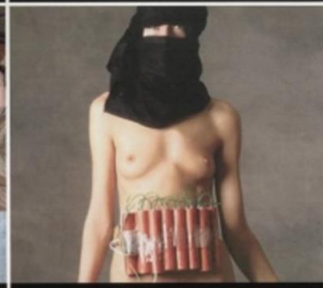
На теле смертника