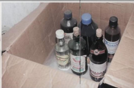
Уберите в безопасное место пожароопасные материалы: краску, бензин, газ в баллонах